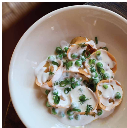
Пельмени с рикоттой и зеленью