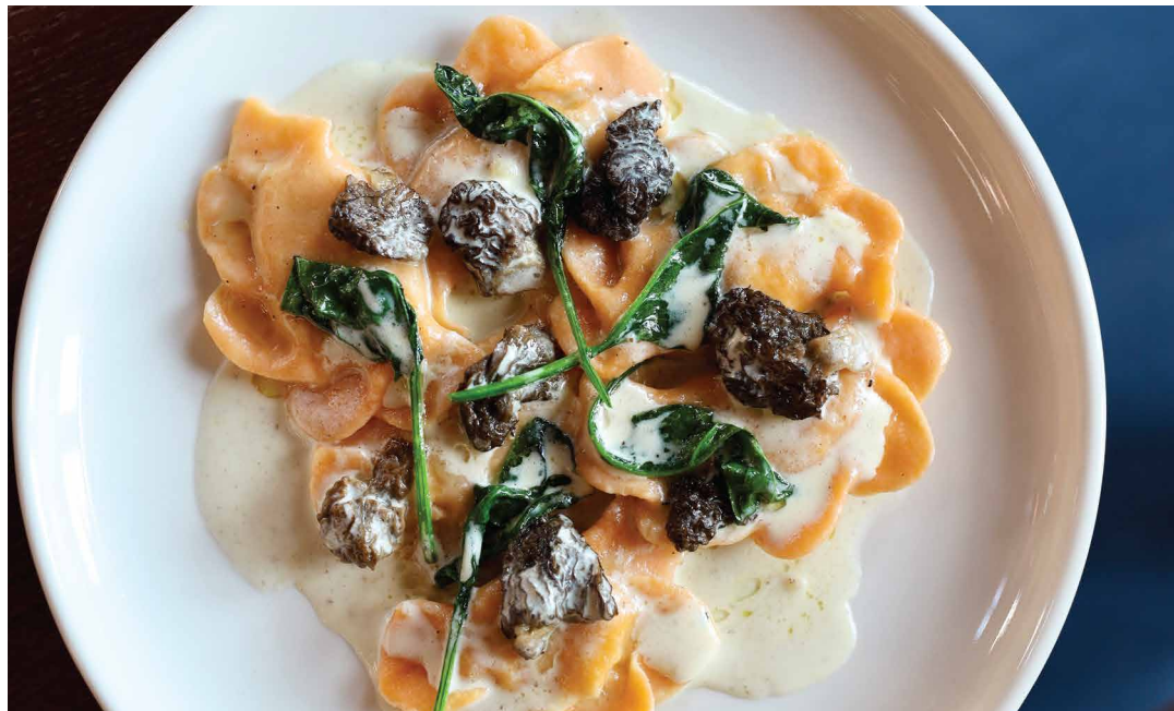
Вареники с картофелем и грибами