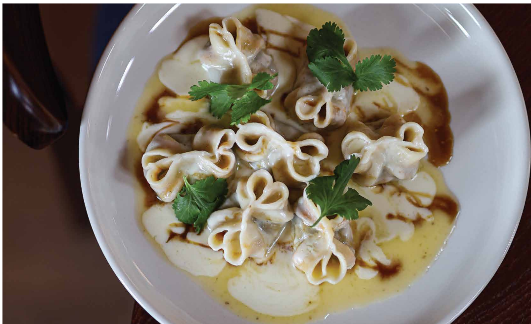
Пельмени из ягненка в сырном соусе