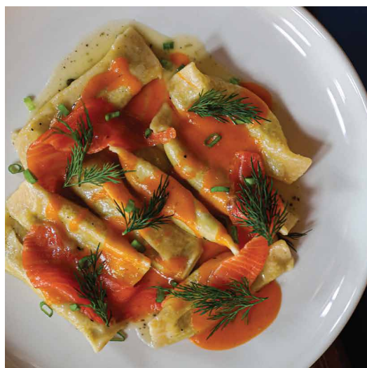
Равиоли с мягким сыром и форелью в томатном соусе