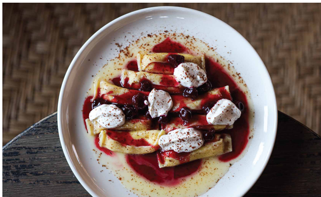
Вареники с творогом и сыром рикотта с вишнёвым соусом