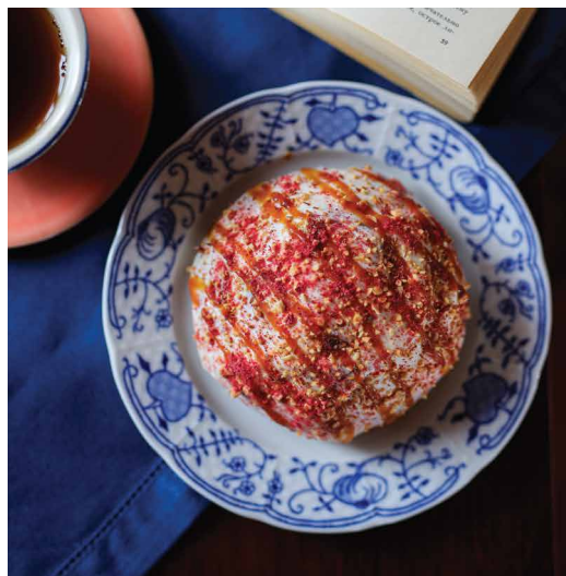
Булочка с корицей